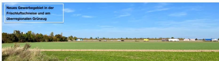
Abbildung 1: Neues Gewerbegebiet an der Autobahnauffahrt

Die Notwendigkeit dieses neuen Gewerbegebietes ist fragwürdig. Wie eine aktuelle Auswertung der BUND Naturschutz Ortsgruppe zeigt, gibt es baureife Gewerbeflächen von mindestens 6,5 ha in Neusäß. Ein Spatenstich für eine neue Wasserstofftankstelle wurde erst im September, wenige 100 m entfernt, im Güterverkehrszentrum Augsburg vorgenommen.